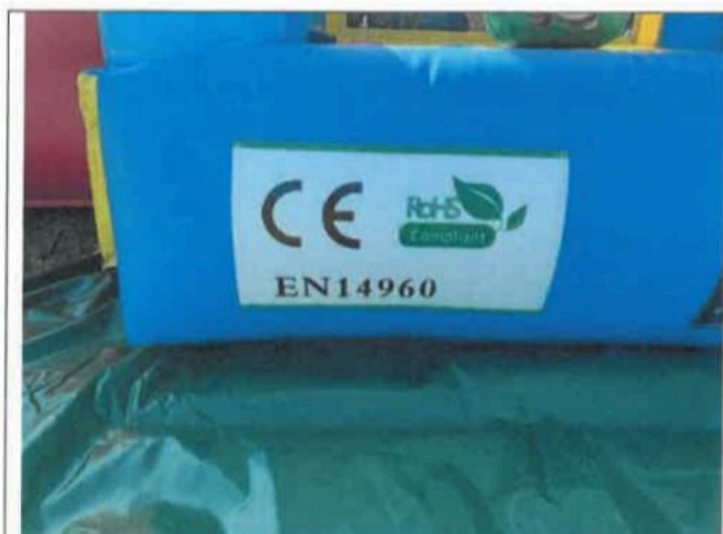
F05- Általános nézet V.