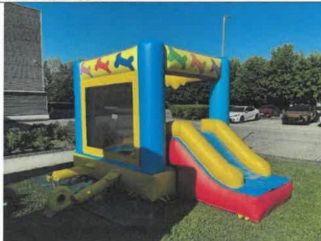
F04- Általános nézet IV.