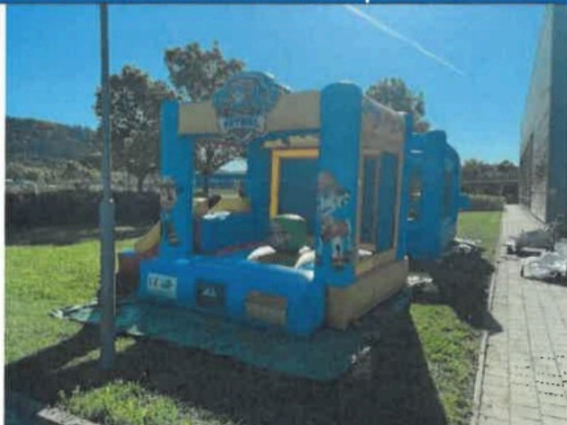
F01- Általános nézet I.