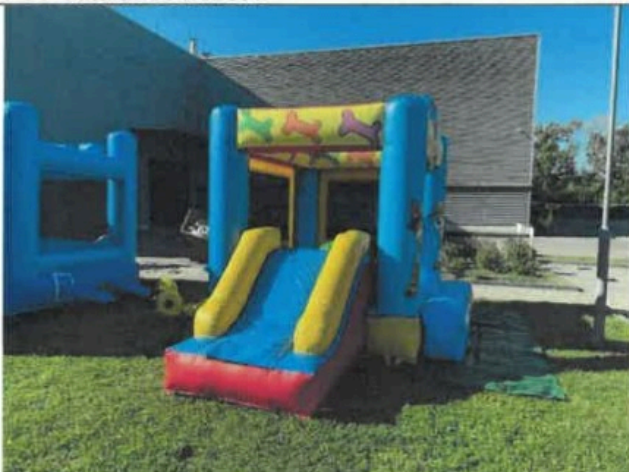
F03- Általános nézet III.