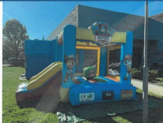
F02- Általános nézet II.