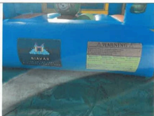
F06- Üzemeltetői és gyártói megjelölés (korlátozások)