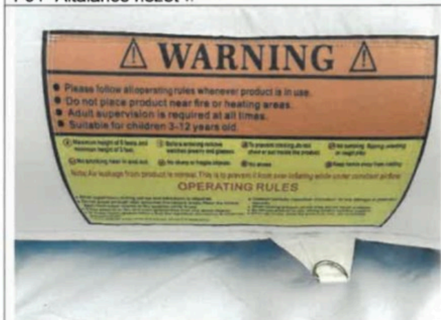
F03- Általános nézet III.