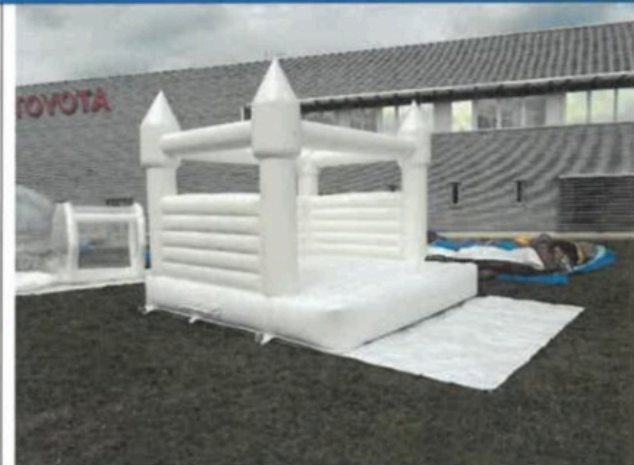
F02- Általános nézet II.