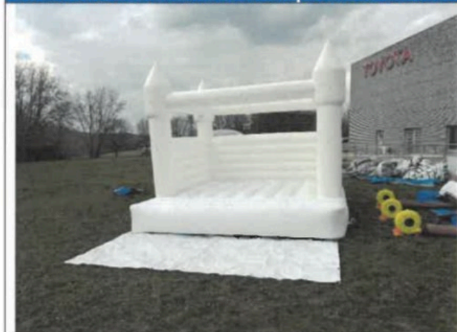
F01- Általános nézet I.