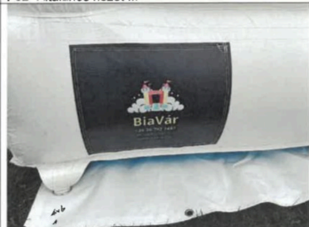
F04- Általános nézet IV.