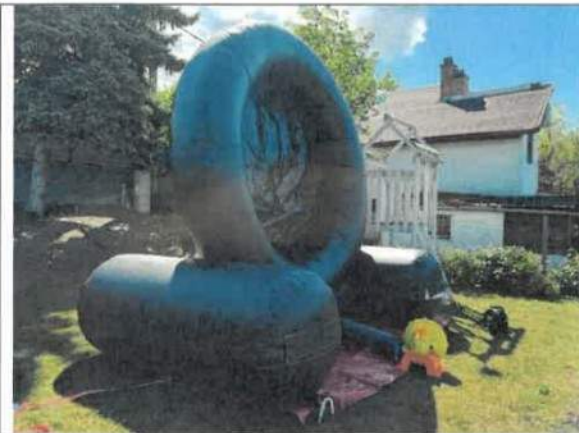
F03- Általános nézet III.