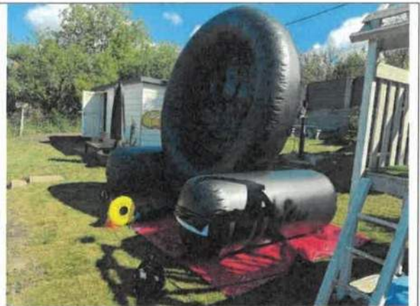
F04- Rögzítő karók