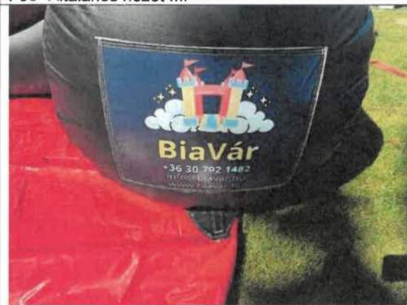
F05- Üzemeltetői megjelölés